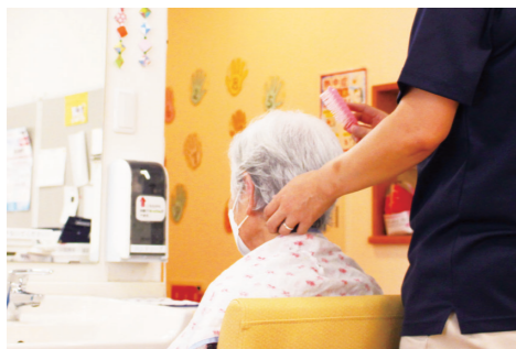
優しい手から笑顔につながります