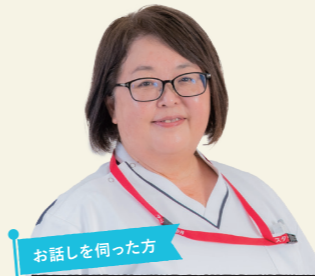
お話しを伺った方