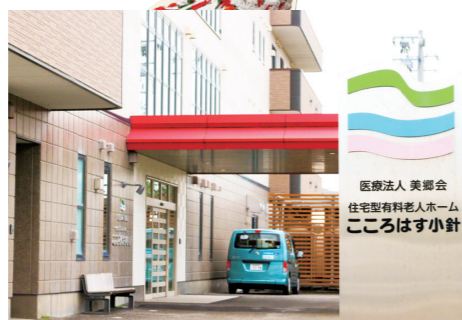
この春でこころはす小針は15周年です！