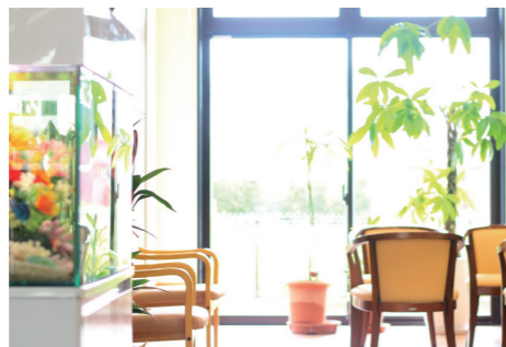
光あふれる癒しの特等席です