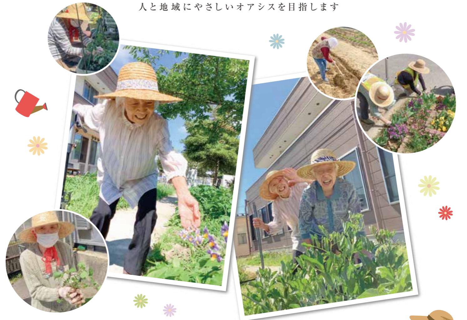
今月の表紙／デイサービスセンターみさと、こころはす西蒲、こころはす旗屋 「各施設の農作業風景」