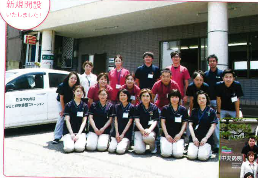
「西蒲中央病院みさと 訪問看護ステーション」