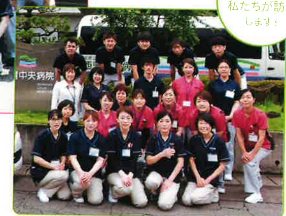
「西蒲中央病院 訪問看護ステーション」