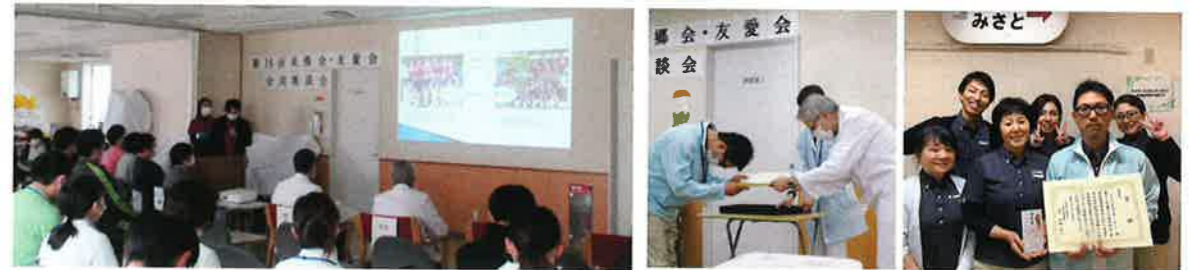
〈理事長賞〉 西蒲中央病院訪問看護ステーション みさと訪問看護ステーション 「コミュニケーション係発足と活動報告」