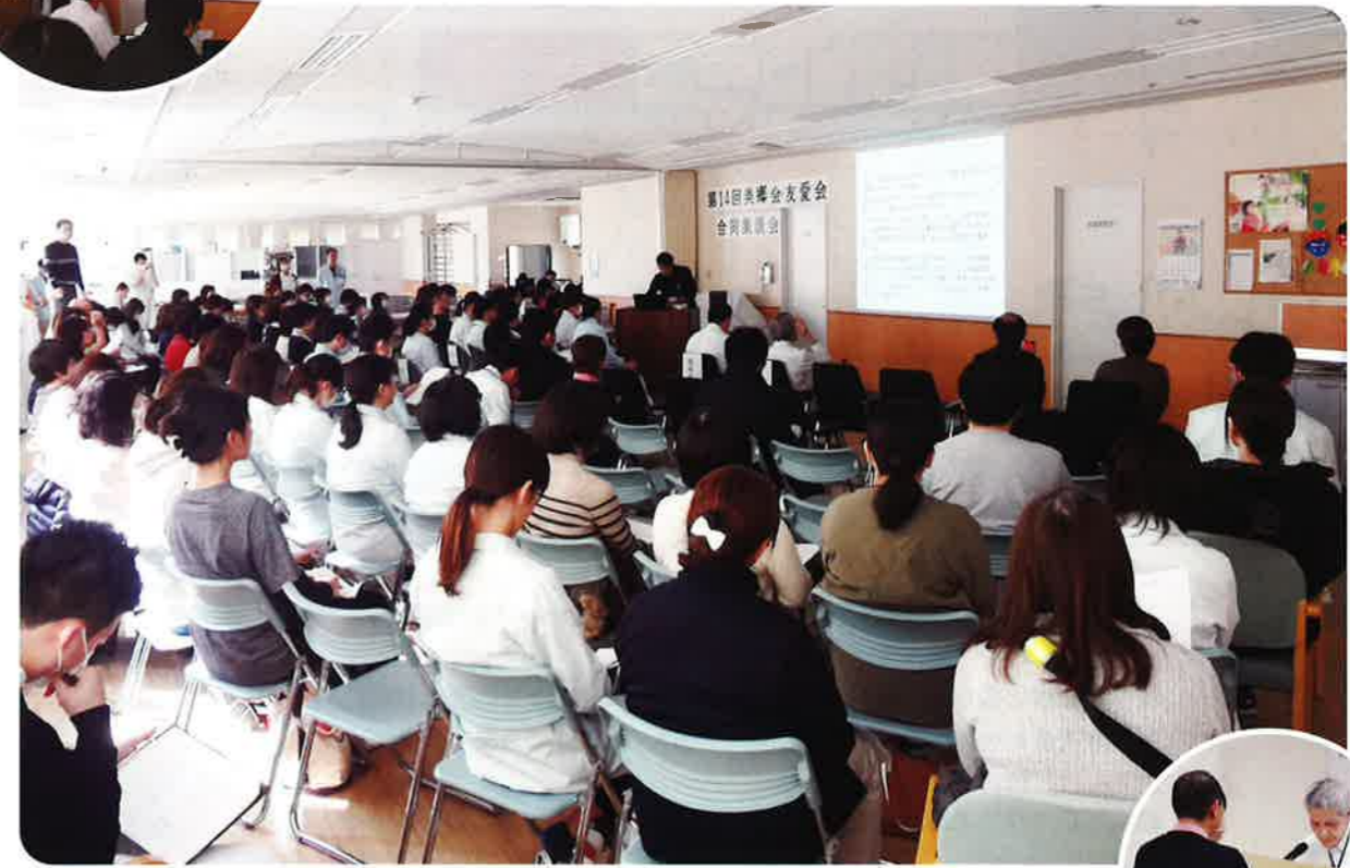
今回の表紙:「第14回 美郷会・友愛会 合同集談会」