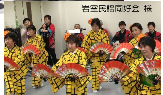
岩室民謡同好会 様