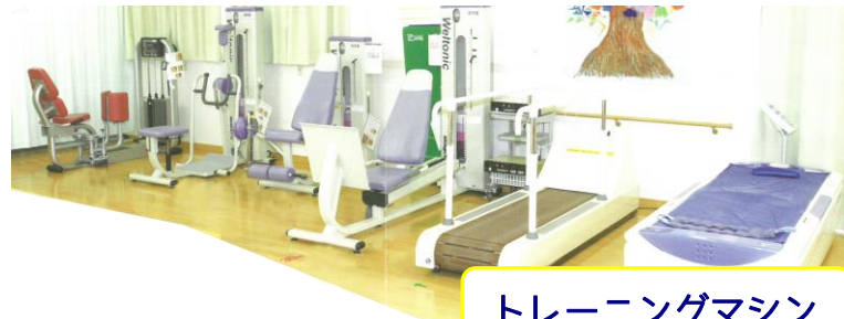
トレーニングマシン

ご利用者の皆様が集う食堂やホール、共同生活室、茶室（お座敷）等が充実しております。また、一般浴室や、特殊浴室などの設備や、トレーニングマシンも豊富にございます。ご利用される方々の状態に合わせ、細やかな話しかけや和やかな雰囲気の中で安心して過ごして頂けます。